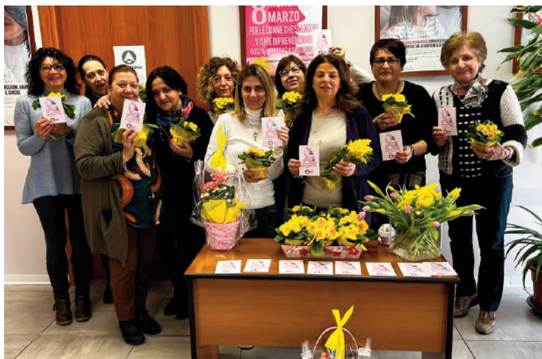
Tanti fiori ANVOLT per le nostre amiche

La gratuità delle prestazioni, elemento cardine dell'azione di ANVOLT, è sempre accompagnata da attenzione alla qualità e all'innovazione tecnologica. Per offrire servizi sempre più precisi, durante la "tre giorni" e nel resto dell'anno, l'associazione investe costantemente nell'ammodernamento delle proprie strutture. Nel solo 2025, la dotazione tecnica è stata arricchita con l'acquisto di nuovi ecografi di ulti-