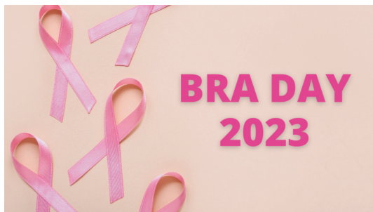
La giornata mondiale di informazione sulla ricostruzione mammaria

In occasione del mese dedicato alla prevenzione del tumore al seno, mercoledì 18 ottobre ha avuto luogo l'iniziativa promossa da SICPRE (Società Italiana di Chirurgia Plastica Ricostruttiva Rigenerativa ed Estetica) volta a promuovere l'importanza della ricostruzione mammaria. Un evento online dal titolo "L'unione fa la forza" a cui hanno aderito anche gli specialisti dei migliori centri ospedalieri specializzati italiani. Sono circa 60.000 all'anno i nuovi casi di tumore al seno: la neoplasia più frequente nelle donne a tutte le età. Promuovere informazione e consapevolezza su questo tumore – dai fattori di rischio, ai trattamenti che abbiamo